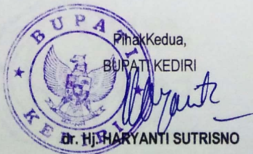
dr. Hj. HARYANTI SUTRISNO

Pihak Kedua akan melakukan supervisi yang diperlukan serta akan melakukan evaluasi terhadap capaian kinerja dari perjanjian ini dan mengambil tindakan yang diperlukan dalam rangka pemberian penghargaan dan sanksi.